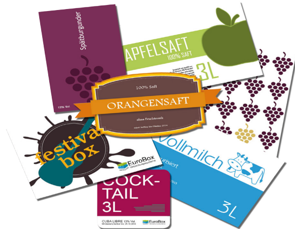
Designvorschläge für Ihre persönliche Bag-in-Box